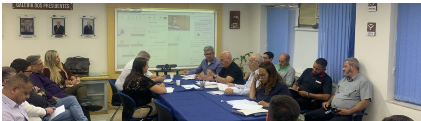
Reunião realizada no dia 3 de abril marcou o início da negociação coletiva 2025 dos trabalhadores da limpeza urbana

Com apoio da Femaco, o Siemaco Guarulhos firmou a Convenção Coletiva 2025 dos trabalhadores em empresas de limpeza urbana de Arujá, Santa Isabel e Guararema, garantindo reajuste de 5,5% nos salários e de 5,87% nos benefícios.